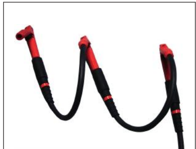
Installation des 3-phasigen Zangenadapter-Sets

Für die ordnungsgemäße Montage der SF6-Adapter sollten die Montagehinweise beachtet werden, um eine Schädigung sowohl des Prüflings als auch des Adapters zu vermeiden. Ferner liegt der Lieferung eine Tube mit Montagepaste bei (Silikonfett wird für die Installation der Adapter benötigt).