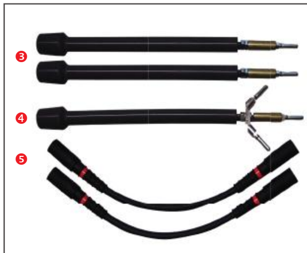
SF-6 Adapter-Set VLF CS-SF6-M12/16 (3-phasig)